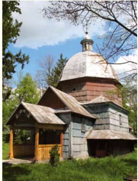
Церква св. Онуфрія (XVII ст.) розташована серед валів давньоруського городища

міста, Нового міста і четвертого міста Яблонова, а оточували його передмістя Довга Сторона, Ліпибоки, Німецький Бік, Воляни, Підзамче. Усі вони об'єднувалися в одне ціле системою гребель, мостів і каналів, якими, подібно до гондольєрів, їздили човнярі-«кумлажники», за що у XIX ст. Буськ отримав назву «Галицької Венеції». Згадується вона й у відомому путівнику Галичиною (втім, його автор Мечислав Орлович без зайвих сантиментів зазначає, що «місцевість ця болотиста і малярійна»). Береги каналів укріплювалися лозою та дерев'яними колодами, покладеними в зруб при мостах, самих мостів на 1866 рік налічувалося 68. Окрім мостів були й легендарні кладки по 400–500 метрів довжиною (куди там нашої переправи у Волиці-Деревлянській!), шириною у 2–3 дошки, на високих стовпах-опорах.