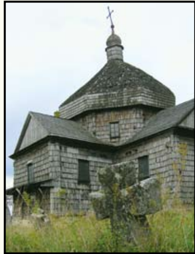
Михайлівська церква (1720 р.) також багато років простояла зачищеною, у забутті, за кількості метрів від іншого замку – в Підгірцях. Нещодавно вона згоріла – а може, була спалена вандалами...

маленький і гордий представник модерного стилю.