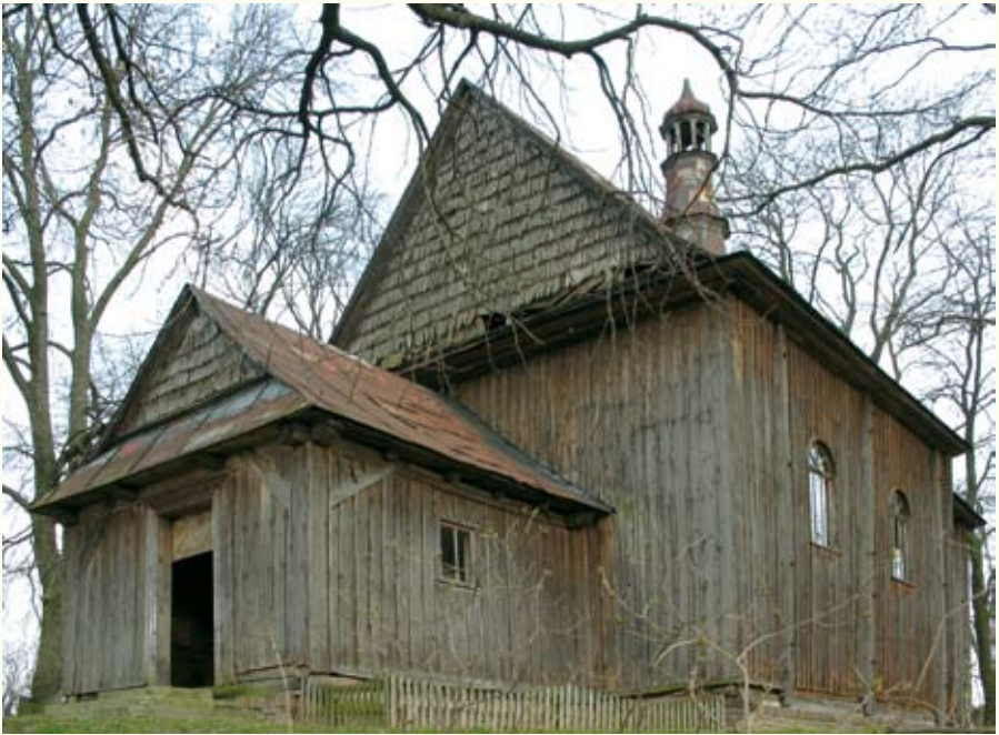
Село Тадані. Костел Відвідання Єлизавети Пресвятою Дівою Марією і св. Теклі (1734 р.)