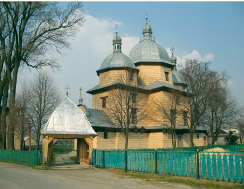
Церква Собору Пресвятої Богородиці (1778 р.) у селі Батятичі

рили бляхою, стіни вкрили ґонтом, зробили нову підлогу. Ще частину робіт виконали кілька років по тому. Значно менше пощастило дзвіниці, на яку, очевидно, весь час бракувало коштів і зусиль. Струнка каркасна дзвіниця з дубових брусів збудована одночасно з церквою. 1762 року, за вїйта Стефана Сидоровича, її ремонтували або ре-