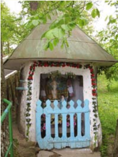
Каплиця, влаштована у стовбурі дуба, символізує печеру святого Онуфрія