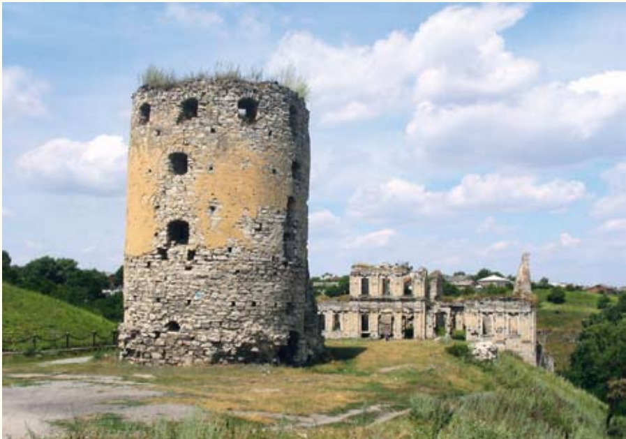
Замок у Скалі-Подільській: Порохова вежа (1538 р.) і палац Адама Тарло (1765 р.)

знаходилась в'їзна брама, до якої вів підйомний міст, який при потребі піднімали на грубих ланцюгах. Роботи з розбудови замку проводились з допомогою та коштом міщан, яких для цього на два роки звільнили від міського податку. Вони були не в образі – адже замок, де розмістився військовий гарнізон, став захисником міста.