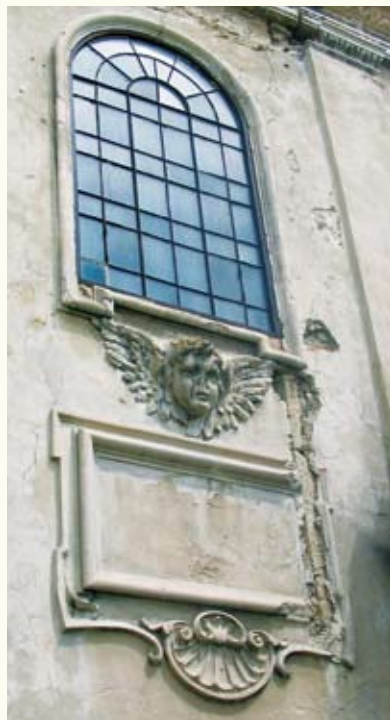
Фрагмент оздоблення фасаду

Неподалік замку височіла вежа ратуші оригінальної ренесансної архітектури, судячи, на жаль, тільки з описів: чотирипроменева