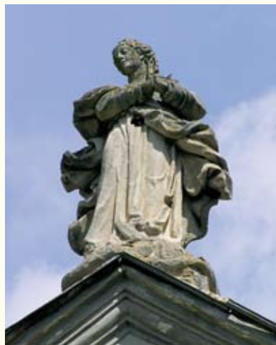
Скульптура на фасаді костьолу

цілком відповідають стилю пізнього бароко. Всередині панує стиль рококо. Пізніші прибудови не позбавили костьол загальних обрисів «калинови». Крипта під костьолом призначалася для поховань членів родини Калиновських. Вона вже давно розорена – але й до сьогодні тут є розкидані рештки людських кісток.