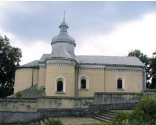
Церква св. Онуфрія (кін. XVI ст.)

храм, і досі служать парафіянам гарні кути ворота, які 1899 року створив невідомий майстер – на згадку про нього залишився викований напис «1899, О.В.»