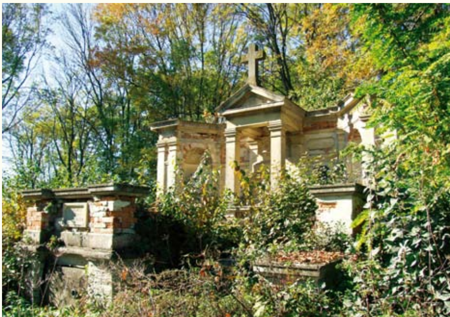
Родинний гробовець Пайгертів, власників Сидорова від поч. XIX ст. до 1939 р.

кав його син Адам Пайгерт (1829–1872), теж поет, перекладач творів Шекспіра. Останнім власником Сидорова, до вересня 1939 року, був онук Адама – Юзеф Каласантій Пайгерт-молодший (1891–1962). До маєтку Пайгертів вела брукована дорога – і тепер уважний мандрівник може відшукати на полі поблизу ферм давній мурований міст через пересохлий ставок. Поруч на полі видно входи в пивниці та підземелля – все, що залишилося від господарських приміщень колишніх поміщиків.