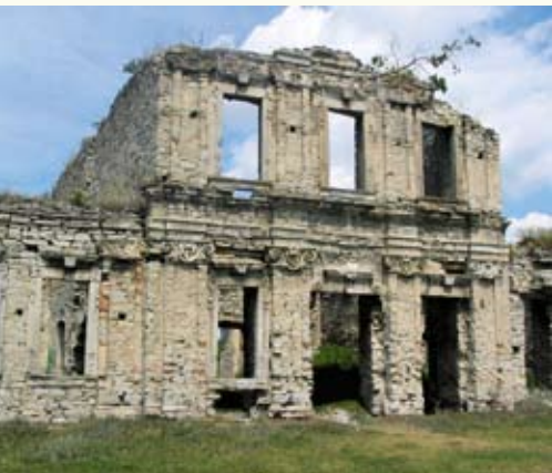
Палац Адама Тарло (1765 р.)

замахується зеленою булавою кудись в бік Польщі, а в лівій руці тримає Переяславську угоду. Розповідають, що за радянських часів угоду неодноразово відламували місцеві патріоти-відчайдухи.