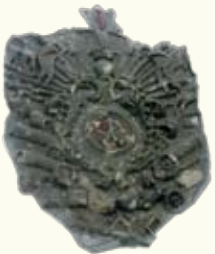
Герб «калинова» в інтер'єрі костьолу

На початку XVII ст. воєвода чернігівський, польний гетьман коронний Марцін Калиновський власним коштом розбудував Усятин. Отак на правому березі Збруча виростили прямокутний у плані замок з чотирма наріжними вежами, костьол, церква, синагога і ратуша з кранницями.