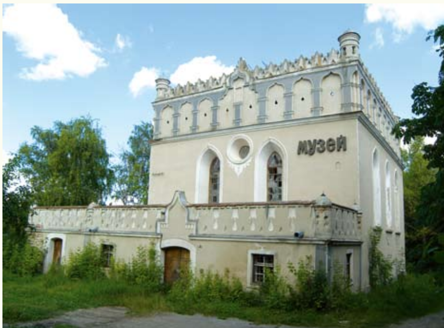
Гусятинська синагога (кін. XVI – поч. XVII ст.) на сучасній фотографії і на малюнку Г. Лукомського (поч. XX ст.)

доричний фриз з тригліфами й метопами, а головний вхід декоровано невеличким портиком іонічного ордера. Стрілчасті готичні вікна мали вітражі в кам'яних рамах. На південному фасаді вікна круглі, між двома могутніми контрфорсами. В інтер'єрі привертає увагу хрещате склепіння і ліпний картуш, обрамований «арматурою» з гармат, ядер, списів, шабель і прапорів, з гербом Калиновських «калинова». Нині костюл є діючим римокатолицьким храмом. Крім нього, до ансамблю бернардинського кляштору, скасованого 1784 року за декретом австрійського уряду, входить скромний корпус келій. Рештки оборонних мурів з наріжними вежами втрачено. Гарний для фотографування ракурс костюлу – над плесом озера – відкривається з боку траси на Пробіжну.