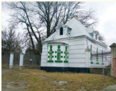
Сторожка у маєтку Голуховських (XIX ст.)

За переказами, під цією липою зізнавався у коханні своїй майбутній дружині Марії Вояковській молодий Михайло Грушевський. Так чи ні, але 14 травня 1896 року в Скалі 29-річний Михайло і 27-річна Марія обвінчалися у церкві св. Миколая. Цей храм існує і тепер – він розташований неподалік замку. Церква з триарковою дзвіницею побудована 1882 року на місці давнішої – оборонної. На більшому дзвоні відлито: «Фундаторь сего