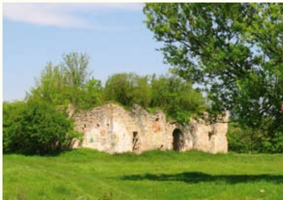
Залишки замку в селі Збриж

а з боку Збруча фортецю захищала висока, стрімка скеля. Стрільниці були облаштовані у стінах другого і третього поверхів замку. Щоб знайти його руїни сьогодні, слід спитати в місцевих дорогу до старого клубу – саме у такий спосіб використовувалися замкові стіни до 1967 року. Дотепер лишилися напівзруйновані потужні стіни, а уважне око вихопить і цікаві деталі: склепіння, портал над входом, напівзасипані переходи, підлогу, вкриту залишками пам'ятника Сталіну, який стояв тут за часів клубу.