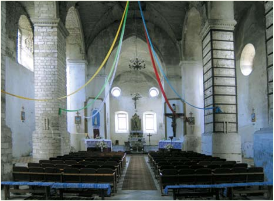
Інтер'єр гусятинського костьолу

1594 року син усятинського кушніра Северин Наливайко, який служив у надвірному війську князя Василя-Костянтина Острозького, дібрав ватагу вірних друзів козаків і очолив повстання проти магнатів, передусім – проти Калиновського, який вбив Севериногового батька. Жорстокою була помста: Наливайко доценту зруйнував Усятин. Повстання поширилося на значному просторі України й Білорусі, а її ватажок зажив слави національного героя, борця за волю й кращу долю. Згодом Наливайко брав участь у походах запорожців проти