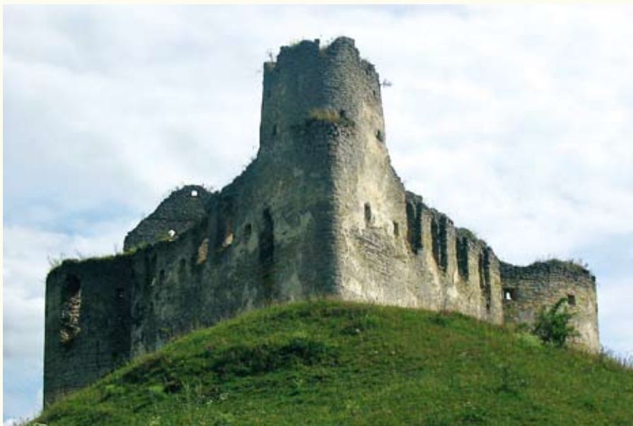
Сидорівський замок (XVII ст.). Північну вежу фланкують півкруглі бастеї, призначені для ведення флангового вогню

прокладанні магістрального газогону Уренгой-Помари-Ужгород у 1970-х роках.